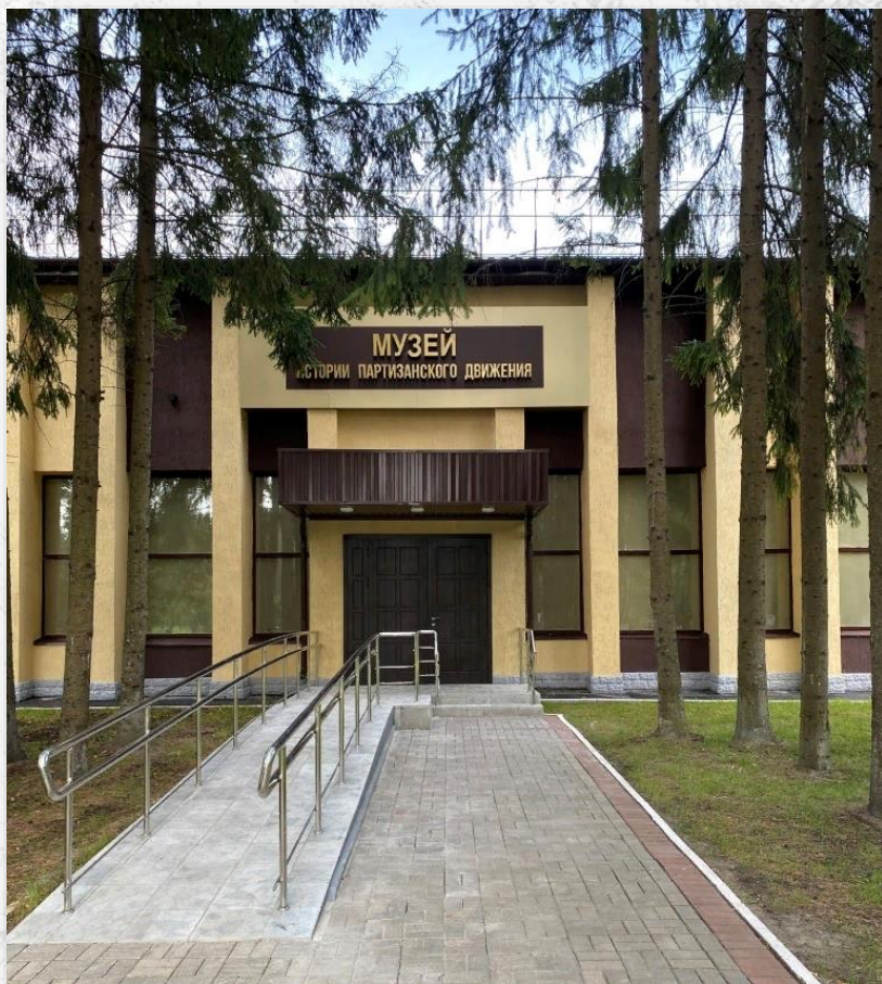
Музей истории партизанского движения